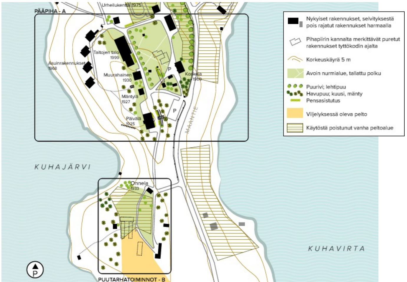
Kuva: Kuhankosken sotilasvirkatalon alueelle sijoittuva rakennuskanta (ote kulttuuriympäristöselvityksestä).