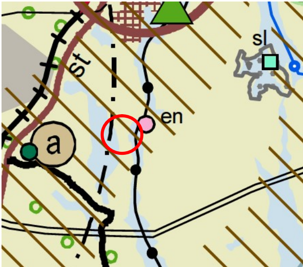
Kuva: Ote maakuntavaltuuston hyväksymästä tarkistetusta maakuntakaavasta. Suunnittelualueen sijainti merkitty punaisella.

Suunnittelualue sijoittuu maakuntakaavan Kulttuuriympäristön vetovoima-alueelle . Merkinällä osoitetaan maakunnan kulttuuriympäristön monimuotoiset aluekeskittymät. Merkintään liittyy seuraava suunnittelumääräys: Alueen kehittämisessä tulee hyödyntää kulttuuriympäristön monimuotoisuutta. Alueidenkäytön suunnittelulla edistetään kulttuuriympäristöjen kestävästä käytöstä ja hoitoa. Alueilla metsien hoito ja käyttö perustuu voimassa olevaan metsälainsäädäntöön.