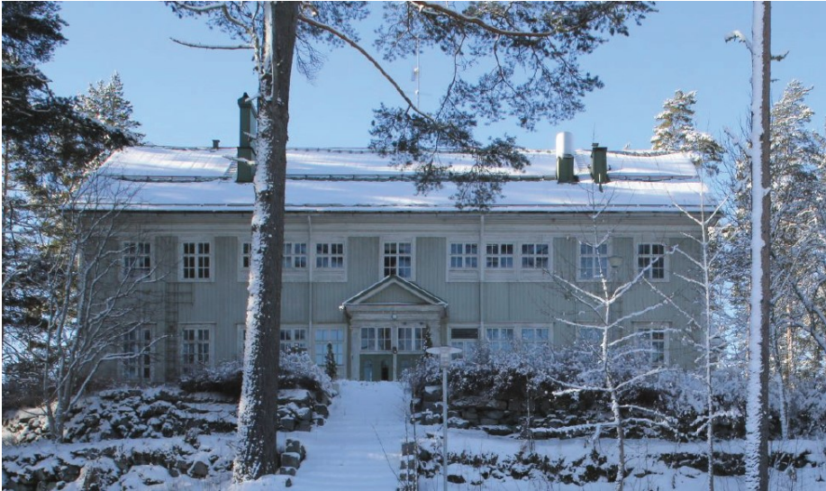
Kuva: Päärakennus Päivälä