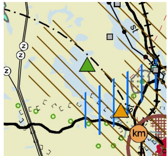
Kuva: Ote maakuntakaavan tarkistuksesta

Multamäki on osoitettu maakuntakaavan tarkistuksessa virkistyskohteena (seudullinen ulkoilualue) . Merkinnällä osoitetaan vähintään seudullisesti merkittävä virkistysalue. Alueilla on voimassa MRL 33 §:n mukainen rakentamisrajoitus. Rakentamismääräys: Alueella sallitaan virkistys- ja retkeilykäyttöä palveleva rakentaminen. Metsien hoito ja käyttö perustuvat voimassa olevaan metsälainsäädäntöön.