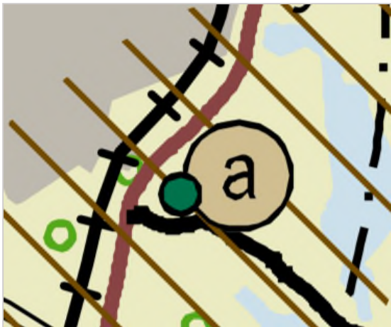
Kuva: Ote maakuntakaavan tarkistuksesta.

Maakuntakaavan tarkistuksessa seututie 637 on merkitty merkinnällä seututie, merkittävä parantaminen . Vihtavuoren taajama on osoitettu kunta-/palvelukeskus kohdemerkinnällä (a) . Merkinnällä osoitetaan palveluvarustukseltaan paikalliskeskustasoisen kunnan tai taajaman likimääräinen sijainti. Suunnittelualue sijoittuu kokonaisuudessaan kulttuuriympäristön vetovoima-alueelle. Suunnittelualueen läheisyyteen sijoittuu valtakunnallisesti merkittävä rakennettu kulttuuriympäristö ja alue rajautuu länsipuolella valtakunnallisesti merkittävään rataan.