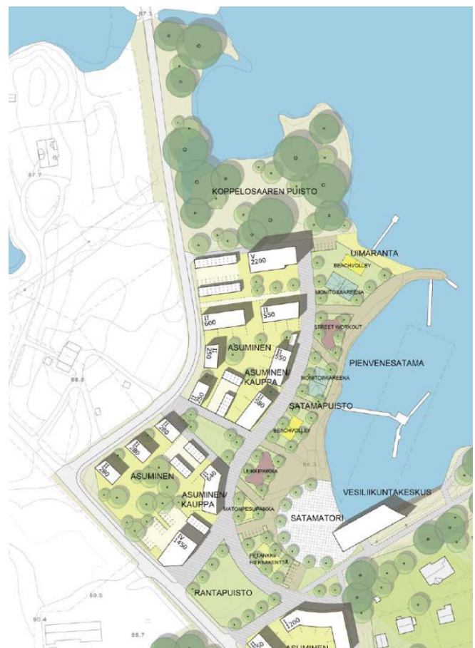
Kuva. Ote kehittämissuunnitelmasta