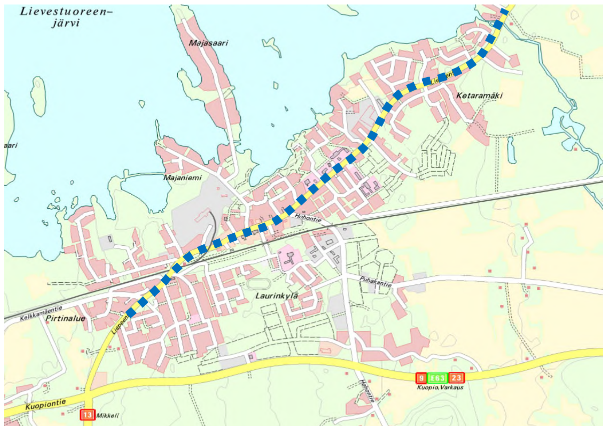
Kuva: Liepeentien osuus, jonka osalta kaduksi muuttamista tutkitaan

Lievestuoreen keskustan poikki kulkeva Liepeentie on yleinen tie, joka on myös taajaman alueella voimassa olevissa asemakaavoissa osoitettu pääosin yleisentien alueena. Osittain Liepeentien käyttötarkoitus on jo muutettu kaduksi uudempien asemakaavamuutosten yhteydessä. Suunnittelun tavoitteena on osoittaa Liepeentien alue kokonaisuudessaan katuna. Käyttötarkoituksen muutos toteutetaan vaiheittain eri asemakaavamuutosten yhteydessä.