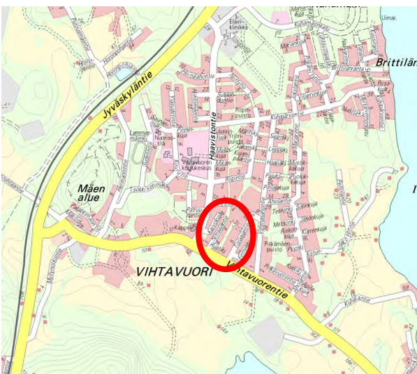
Kuva: Suunnittelualueen sijainti

Asemakaavan muutoksen tavoitteena on tarkastaa kaavallisesti alueen kulkuyhteyksiä sekä tehdä tarkistuksia korttelialueiden rajauksiin.