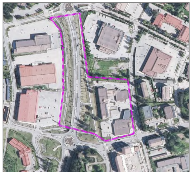
Kuva: Suunnittelualueen sijainti ja alustava rajaus