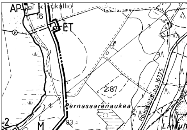
Kuva: Ote Kanavareitin rantaosayleiskaavasta

Suunnittelualue sijoittuu osittain Kanavareitin rantaosayleiskaavan osa-alue III (Torronselkä) alueelle, joka on hyväksytty kunnanvaltuustossa 10.12.2001 62 §. Suunnittelualueelle sijoittuu yleiskaavan maa- ja metsätalousaluetta (M) sekä yhdyskuntateknistä huoltoa palvelevien rakennusten ja laitosten alue (ET).