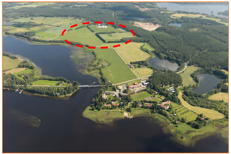
Kuva: Suunnittelualueen sijainti