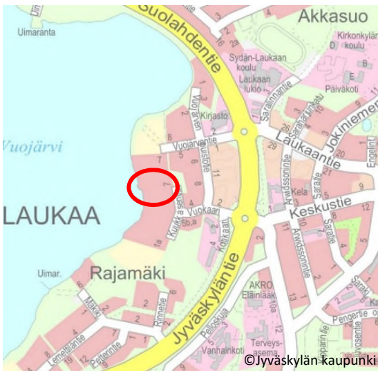
Kuva 1. Suunnittelualueen sijainti.

Suunnittelualue sijaitsee Laukaan kirkonkylän taajaman keskustassa, Vuojärven ranta-alueella. Kaavamuutos-alue käsittää korttelin 955 AO-tontit 4 ja 5. Alueen koko on noin 0,81 ha. Suunnittelualueelle sijoittuu vanha maatila pihapiireineen. Alue on yksityisen maanomistajan omistuksessa.