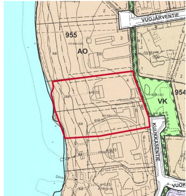
Kuva 4. Ote voimassa olevasta asemakaavakartasta suunnittelualueen kohdalta. Suunnittelualueen alustava raja näkyy kuvassa punaisella. Kaava-alueen raja tarkentuu kaavaprosessin aikana.

Olemassa olevassa asemakaavassa suunnittelualue on osoitettu erillispientalojen korttelialueena (AO). Suunnittelualue rajautuu pohjoisessa ja etelässä viereisiin erillispientalotontteihin. Idässä suunnittelualue rajautuu Kuukkasentien katualueeseen sekä viheralueeseen (leikkipuisto, VK). Viheralueelle kaavamuutosalueen vastaiselle rajalle on asemakaavassa osoitettu ohjeellinen jalankululle varattu tie.