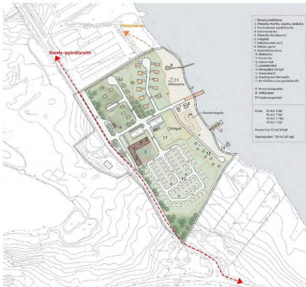
Kuva 3. Ote Ratsurannan kehittämissuunnitelmasta 1.6.2021 (A-Insinöörit).