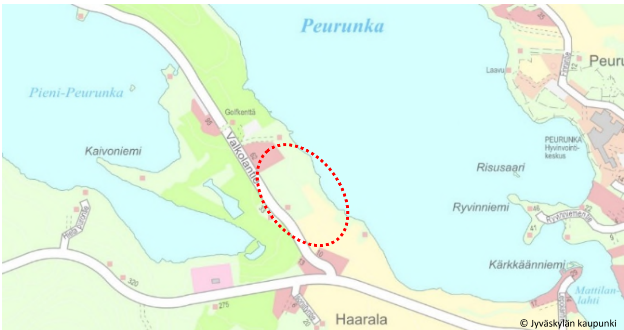
Kuva 1. Suunnittelualueen sijainti merkittynä punaisella katkoviivalla. Alueen rajausta tarkentuu suunnittelun aikana.

Suunnittelualue on Laukaan kunnan omistuksessa. Alue rajautuu itä-/koillisreunastaan noin 300 metrin matkalla Peurunkajärveen. Rannassa sijaitsee kunnan ylläpitämä uimaranta sekä noin 30 soutuvenepaikan venevalkama ja veneenlaskupaikka. Pohjoisessa, luoteessa ja lännessä alue rajautuu kunnan omistamiin maa-alueisiin, joilla toimivat vuokralaisina Peurunkagolf Oy ja Tervon Puutarha Oy. Kaakossa ja etelässä alue rajautuu yksityisomistuksessa oleviin kiinteistöihin. Kaava-alueen rajausta tarkentuu suunnittelun aikana.