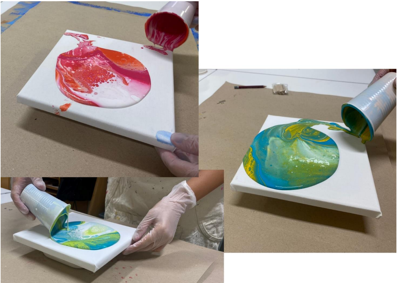
Akryylien kaatotekniikka oli erityisen suosittua teemaopinnoissa.

Edellisvuoden tyyliin teemaopinnoissa opiskelijat suunnittelivat ja lähtivät toteuttamaan omia taideprojekteja. Opiskelijat saattoivat suunnitella suuren koko lukuvuoden kestävä projektin tai tehdä sarjan pienempiä kokonaisuuksia. Näin opiskelijat pystyivät hyödyntämään yhteisissä opinnoissa keräämäänsä osaamista, niin materiaalien kuin tekniikoiden suhteen.