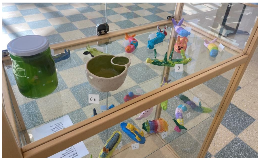
Merietanoita ja teemaopiskelijoiden töitä 2023.

Kevään kohokohtana oli jälleen näyttely kirjastolla. Saimme koottua monipuolisen teoskokoelman teemaan ”pinnan alla”. Esillä oli niin maalauksia, piirroksia, kollaaseja ja patsaita. Teemaopinnoissa opiskelevat kuvilliset esittelivät näyttelyssä suunnittelemiensa projektien teoksia ja muilla ryhmillä oli näyttelyssä ryhmäkohtaiset aiheet.