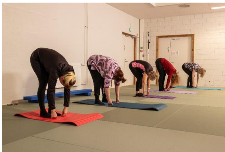
Selkärullaus Pilates-tunnilla, syksy 2023.

Aikuisten kursseista ensimmäisten ilmoittautumisviikkojen aikana eniten osallistujia tuli Zumba®-fitnesstanssikurssille, Pilates-kursseille sekä joogakursseille. 7–12-vuotiaille lapsille suunnatut Akrobatia-kurssit toteutuivat tuttuun tapaan lähes täysillä osallistujamäärillä. Suosittuja olivat myös perinteiset kuntojummat, kuntonyrkkeilykurssit ja Lavis®-lavatanssijumppa. Etäkursseja toteutettiin kolme. Kuntosaliharjoittelun starttikurssit ja ”Tutustu”-tyyppiset lyhytkurssit eivät tänä vuonna toteutuneet. Uusia kursseja olivat Barre ja Toiminnallinen liikkuvuus.