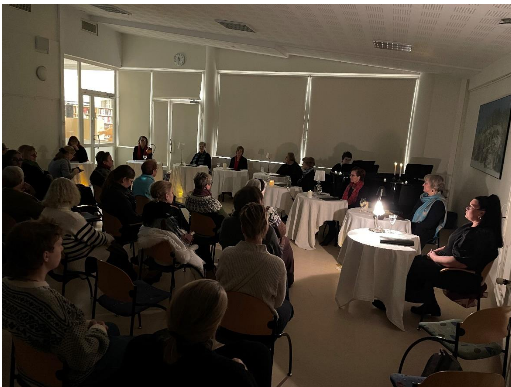
Runomatinean tunnelmaa.

Kirjoituskurssilaisten yhteinen runomatinea 4.12.2023 "Vain yövalo puhuu" oli myös yksi syyskauden ja vuoden päätöstapahtumista. Laukaan pääkirjaston opintosali täyttyi runojen ääreen tulleista kuulijoista.