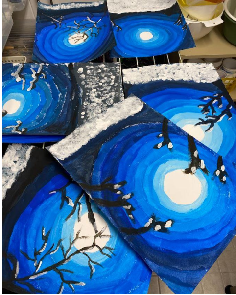
Temperatyöt odottamassa seuraavaa opetuskertaa.

Edellisvuoden tyyliin teemaopinnoissa opiskelijat suunnittelivat ja lähtivät toteuttamaan omia taideprojekteja. Opiskelijat saattoivat suunnitella suuren koko lukuvuoden kestävä projektin tai tehdä sarjan pienempiä kokonaisuuksia. Näin opiskelijat pystyivät hyödyntämään yhteisissä opinnoissa keräämäänsä osaamista, niin materiaalien kuin tekniikoiden suhteen.