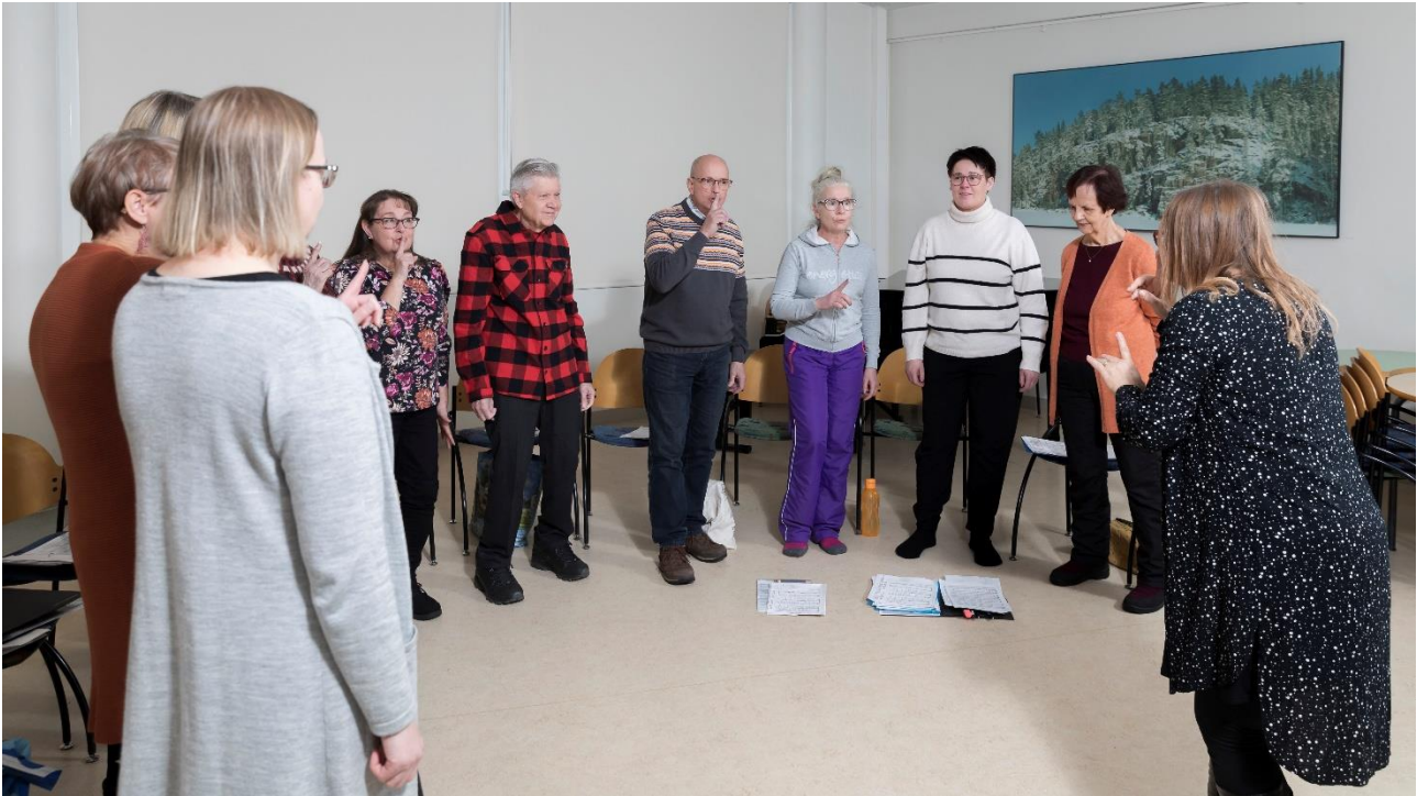
Laukaan viihdekuoron harjoituksissa on mukavaa.

den loppupuolella kuultiin jouluisia musiikkia kuorojen yhteisessä Vain rauhaa -konsertissa sekä Viihdeorkesterin Joulupukki matkaan jo käy -konsertissa. Esiintymisiin harjoittelu tuo oman innostavan lisänsä ja tavoitteita musiikkiharrastukseen.