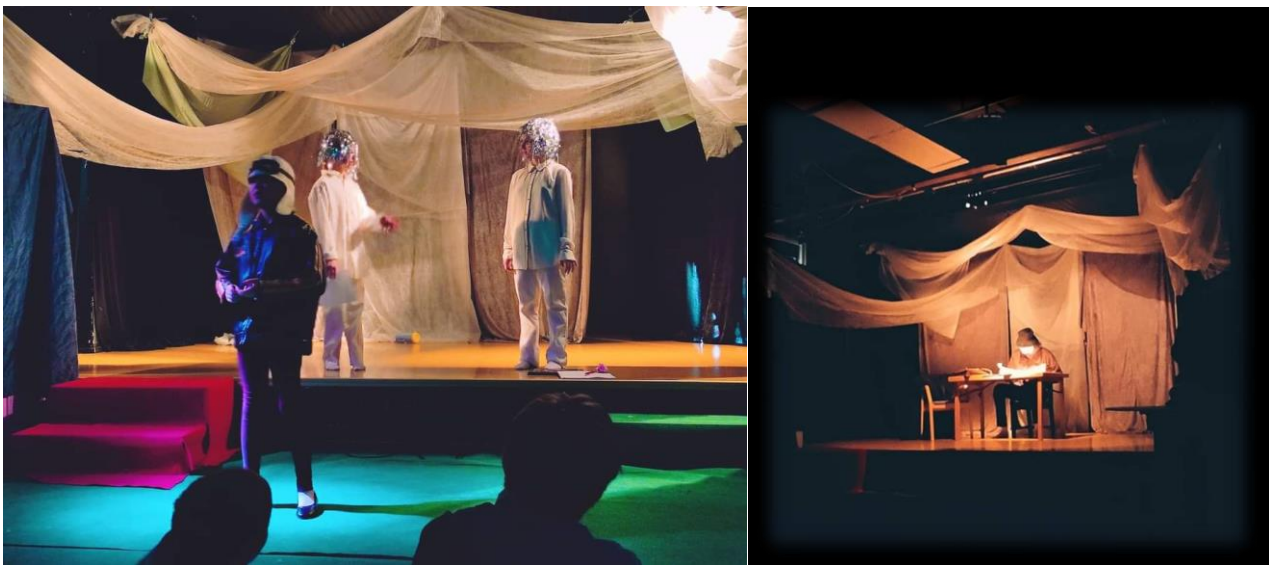
Tunnelmia Laukaan näyttämöt –tapahtumasta.

Syksyllä ryhmä sai uusia harrastajia ja alkusyksystä tehtiin ryhmäytymiseen ja vuorovaikutukseen liittyviä tehtäviä, leikittiin teatterileikkejä ja tutustuttiin samalla toisiimme. Mielikuvaharjoitteita musiikkia apuna käyttäen heräteltiin oman rajattoman mielikuvituksen käyttöä ideoiden lähteenä. Lokakuussa päästiin katsomaan Laukaan teatterin Vaahteramäen Eemeli -näytelmää. Syysloman jälkeen ryhmässä alettiin suunnitella isompaa lukuvuoden päättävä joulusta esitystä, jossa perheenäiti kyllästyy jouluun liittyviin vaatimuksiin ja suorituspaineisiin ja ryhtyy lapsinensa joululakkoon ja päättyy joulumielenosoitukseen eduskuntatalolle saakka. Onneksi perheen mummo ystävänsä ja tonttujen avustuksella järjestävät asiat lopulta parhain päin ja joulu vietetään hyvillä mielin. Esitys esitettiin läheisille ja ystäville joulukuussa. Kauden päätteeksi vietettiin pikkujouluja.