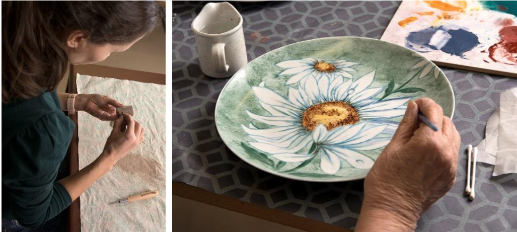
Keramiikka ja posliininmaalaus.