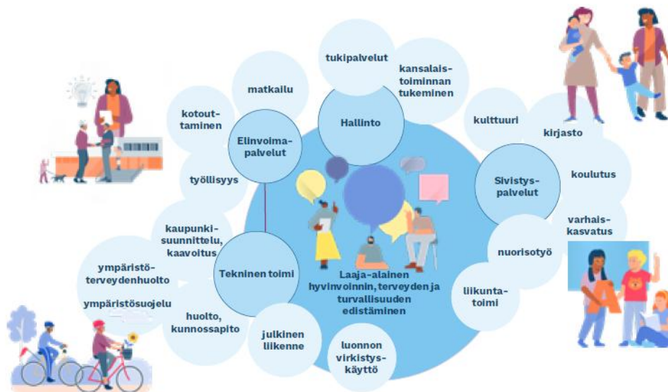
Kuva. Laaja-alainen hyvinvoinnin, terveyden ja turvallisuuden edistämisen yhteistyö kunnassa (Kuntaliitto)

Hyvinvoinnin ja terveyden edistäminen kunnassa on asukkaiden hyvinvointia ja terveyttä tukevaa sekä edistävää toimintaa, jota tehdään laaja-alaisessa yhteistyössä eri toimialoilla sekä tiiviissä yhteistyössä hyvinvointialueen ja muiden toimijoiden kanssa. Myös asukkailla itsellään on tärkeä rooli kunnan tarjoamien hyvinvoinnin edellytysten hyödyntämisessä.